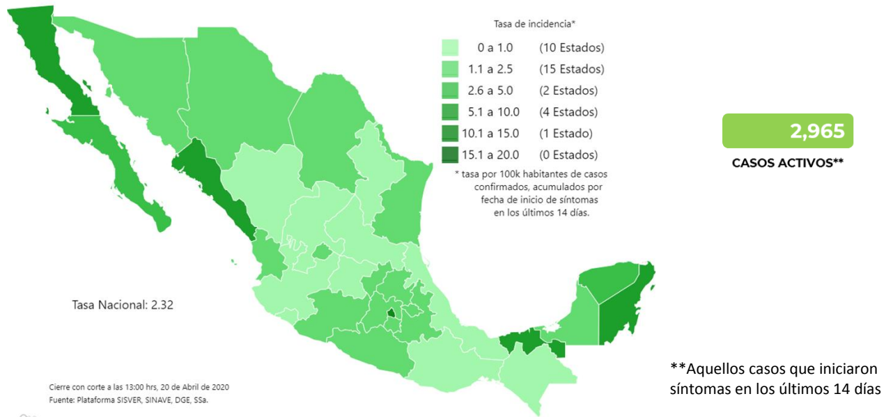
Mapa de Tasa de Incidencia de Casos Confirmados Activos por 100,000 habitantes