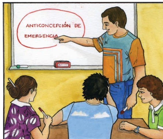
Derecho a obtener información sobre las PAE