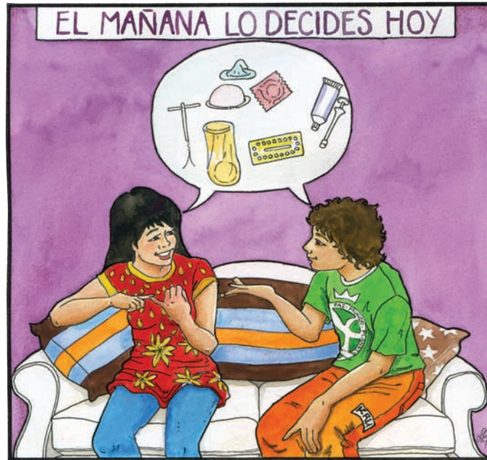
El mañana lo decides hoy