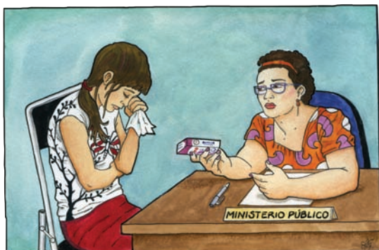
Las PAE en los servicios legales