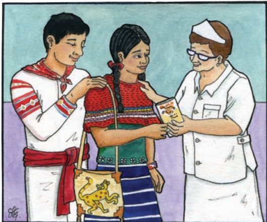
Las PAE en los servicios de salud