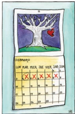
¿Cuándo se pueden tomar las PAE?