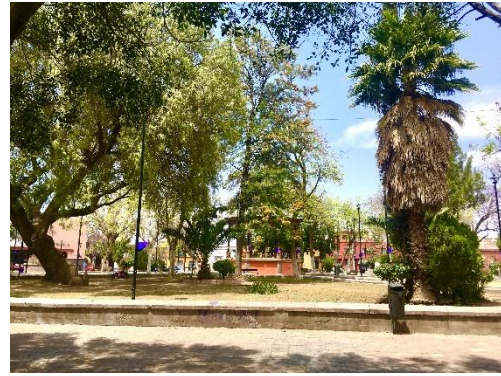
Jardín de San Miguelito