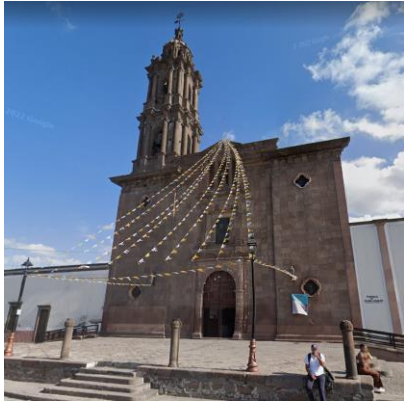
Parroquia de San Juan de Guadalupe