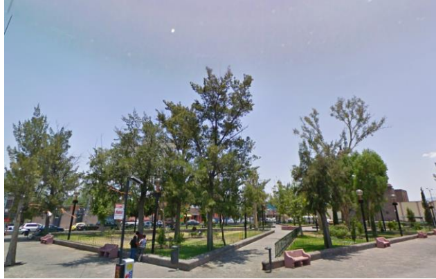
Jardín de San Juan de Guadalupe

Se comenzó a poblar aproximadamente en 1616 con algunos mestizos y mulatos. Era un erriazo distante. A ese sitio se le conoció más tarde como Tierra Blanca.