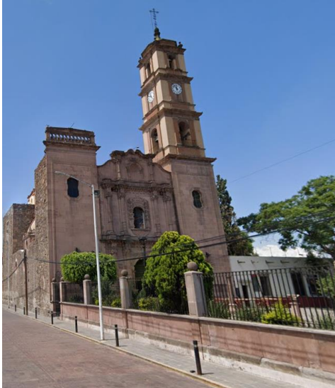
Parroquia de Santiago Apóstol