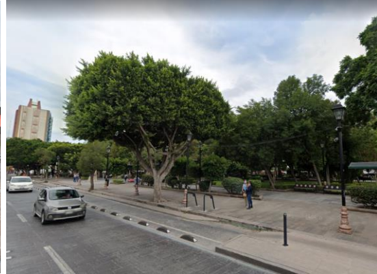
Jardín de Tequisquiapan

Fundado hacia 1593 al poniente de la ciudad. El nombre náhuatl significa “lugar de tequesquites”. Ahí se establecieron huertas de frutas y legumbres que abastecían la ciudad, pues poseía varios ojos de agua; además, estaba en las inmediaciones del río Santiago.