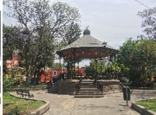
Jardín de San Sebastián

San Sebastián fue doctrina de agustinos, que se establecieron por licencia del conde de Monterrey el 22 de septiembre de 1603, para erigir en la provincia de San Luis un monasterio con “iglesia y campana”.