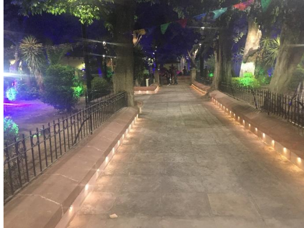
Jardín de Tlaxcala, Ponciano Arriaga

El primero de los pueblos de indios o barrios del recién fundado San Luis Potosí fue Tlaxcalilla, donde se congregaron varias familias tlaxcaltecas que se habían asentado junto a los guachichiles, en el primitivo puesto de San Luis; el pueblo llevó por nombre Nuestra Señora de los Remedios.