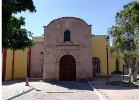
Parroquia de San Cristobal del Montecillo