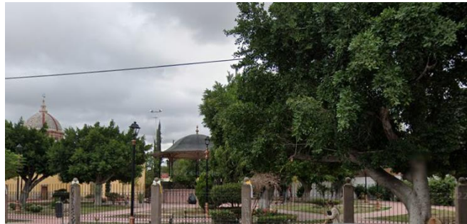
Jardín del Montecillo

Se fundó al oriente de la ciudad en 1600. Se pobló principalmente por tarascos y otomíes, separado de la ciudad por la Lagunita y por la huerta de los carmelitas, la actual alameda. Esa parte carecía de agua o era montuosa, por lo que no reunía las características mínimas para constituirse en pueblo.