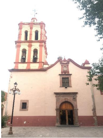
Parroquia de Nuestra Señora de la Asunción