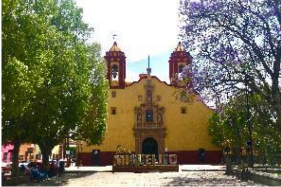
Parroquia de San Miguel Arcángel