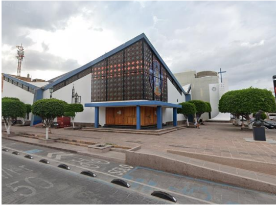
Parroquia de Nuestra Señora de los Remedios