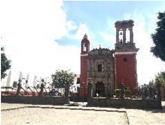
Parroquia de San Sebastián Martir