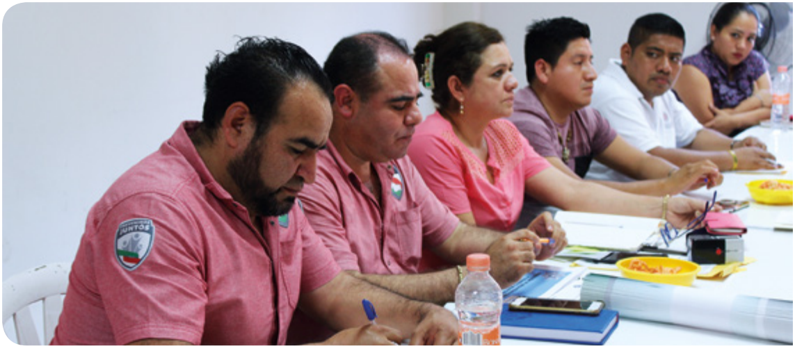
Sesión de Comité en el municipio de Coxcatlán. 11 de Marzo de 2020.

Como parte de la coordinación con los municipios de la Entidad en materia de seguridad, se implementan acciones que involucren la participación de la sociedad en las políticas públicas de prevención que vinculen a la ciudadanía con las autoridades de seguridad pública en los municipios y sus comunidades, brindando asesoría técnica a los 58 ayuntamientos para promover la participación de la comunidad en la contribución para la disminución de la violencia, y el mejoramiento de la función de las instituciones de seguridad, aún en tiempos de COVID-19, en donde las sesiones se realizaron a través de plataformas digitales.