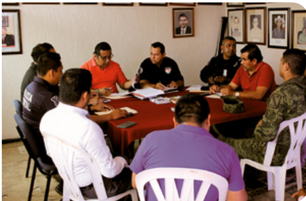
Sesión de Consejo en el municipio de Tanquián de Escobedo. Marzo 2020.

En este quinto año de la Administración se continúa brindando asesoría técnica y apoyo a los 58 municipios en materia de seguridad, apoyando en la instalación y desarrollo de los Consejos Municipales de Seguridad Pública, mediante los cuales se pueden coordinar, planear y evaluar las acciones de seguridad pública en cada municipio, de acuerdo a las problemáticas específicas de la región, involucrando a las autoridades de los tres órdenes de gobierno dentro de los ámbitos de sus competencias y de igual manera, para dar cumplimiento a las medidas establecidas por las autoridades sanitarias para evitar el contagio del COVID-19, se llevaron a cabo las sesiones a través de plataformas digitales.