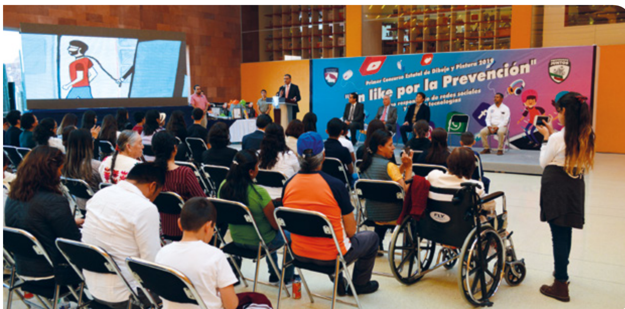
Primer Concurso Estatal de Dibujo y Pintura 2019: Un Like por la Prevención .

Aunado a lo anterior, se fortalecieron las capacidades profesionales del personal operativo asignado a la prevención del delito que trabaja en la implementación del programa, a través de la actualización de un curso de información sobre prevención de delitos informáticos y dos cursos ante el Consejo Nacional de Normalización y Certificación de Competencias Laborales (CONOCER), siendo imprescindible que los servidores públicos que tienen a su cargo labores de prevención se capaciten, desarrollen adecuadamente sus habilidades y se certifiquen.