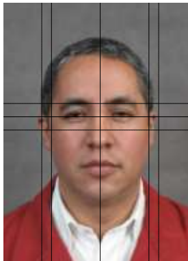
Imagen ejemplo 1