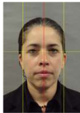
Imagen ejemplo 2