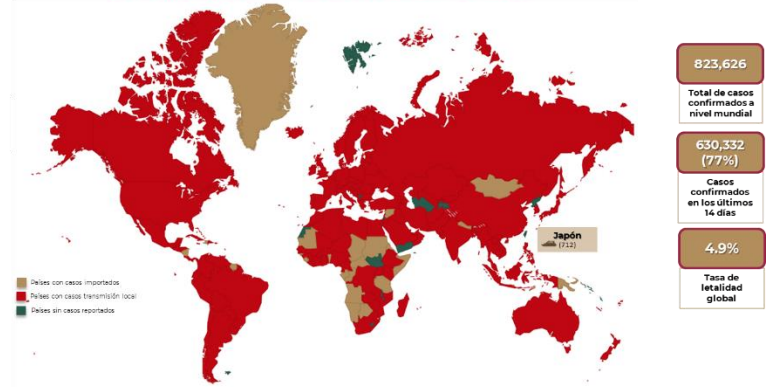
Distribución global de casos confirmados de COVID-19 por SARS-CoV-2 por laboratorio al día 01 de abril de 2020.

*Se reportan 72 casos identificados en un crucero internacional en aguas territoriales japonesas.