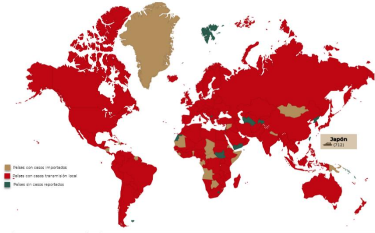
Distribución global de casos confirmados de COVID-19 por SARS-CoV-2 por laboratorio al día 03 de abril de 2020.