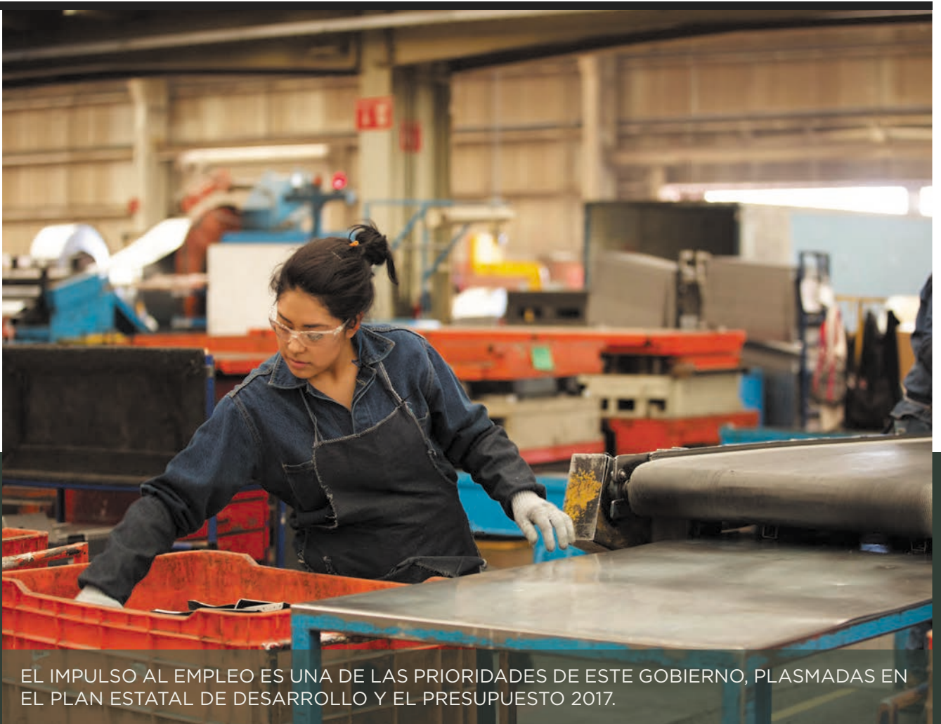
EL IMPULSO AL EMPLEO ES UNA DE LAS PRIORIDADES DE ESTE GOBIERNO, PLASMADAS EN EL PLAN ESTATAL DE DESARROLLO Y EL PRESUPUESTO 2017.

Luego, la Federación lo regresa vía participaciones conforme a lo establecido en el artículo 3-B de la Ley de Coordinación Fiscal y esto ocurre tanto en el Ejecutivo, Legislativo, Judicial, organismos descentralizados y autónomos, la Auditoría Superior del Estado (ASE) y los municipios. ■