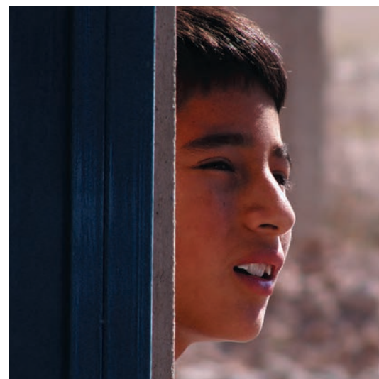
NUESTRA PORTADA

Publicación bimestral de la Secretaría de Finanzas Gobierno del Estado de San Luis Potosí Marzo 2017, Año 2, Número 3 San Luis Potosí, S.L.P, México