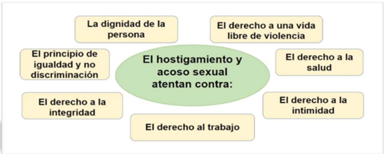
Imagen 2. Derechos contra los cuales atentan el hostigamiento y el acoso sexual

Problemas sociales: se mantiene impune e invisibiliza la violencia de género, se mantienen relaciones y concepciones sexistas.