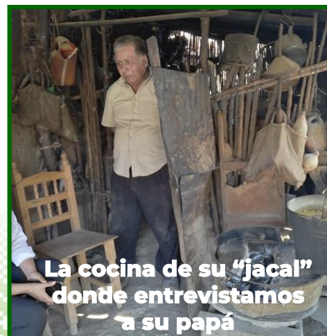
La cocina de su “jacal” donde entrevistamos a su papá