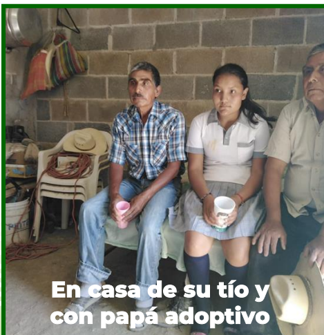
En casa de su tío y con papá adoptivo