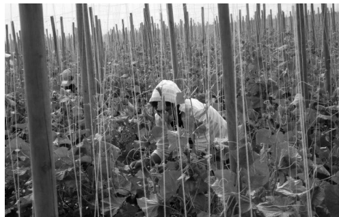
Los roles de género tradicionales y patrones culturales influyen en el tipo de trabajo en que son explotados las niñas y niños.