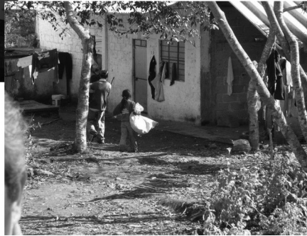
Las niñas son preferidas para las labores en la industria maquiladora y en el servicio doméstico.