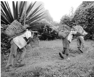
Los niños son dirigidos más a los sectores minero y pesca debido a la perspectiva de género.